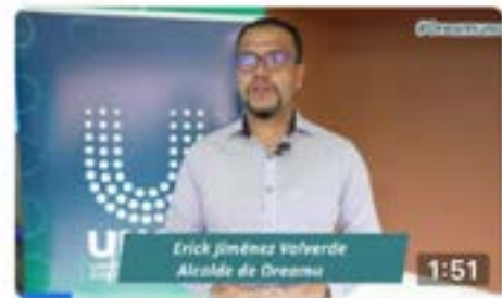
Compartimos el video del Encuentro de #SeguridadCiudadana desde la...

Sumado a ello, el perfil de Instagram tiene un alcance de 66324 personas, con respecto a los productos mencionados anteriormente. Es importante mencionar que la página de Facebook cuenta con 9694 seguidores e Instagram con 470 seguidores.