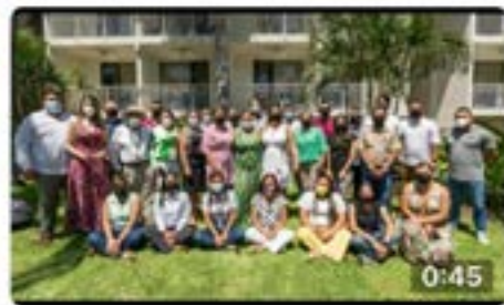
En el marco del programa #SembremosSeguridad participamo...