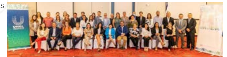
Figura 6. Municipalidades beneficiarias del proyecto mUEve

El proyecto tiene una duración de 5 años, iniciando el 07 de julio del 2020 y finalizando el 07 de julio del 2025. Cuenta con un importe máximo de subvención de 4.921.968 EUR. Además, ha tenido el apoyo de algunas instituciones del Gobierno Nacional con competencias vinculadas, como el IFAM, MOPT, INVU, MIVAH e INCOFER. Finalmente, se debe indicar que las Municipalidades beneficiarias son las siguientes: